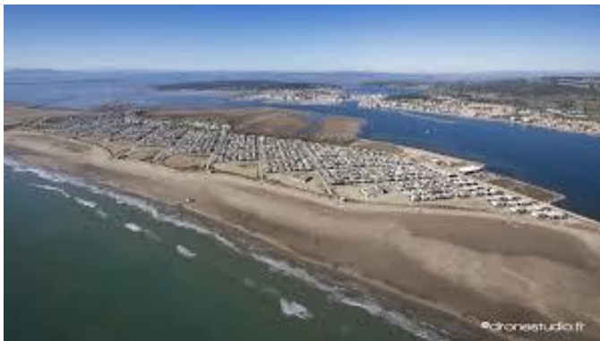
Plage de Gruissan

Des temps libres seront laissés aux enfants afin de privilégier les moments de farniente, de complicité et permettre l'approfondissement de la connaissance de la vie en collectivité.